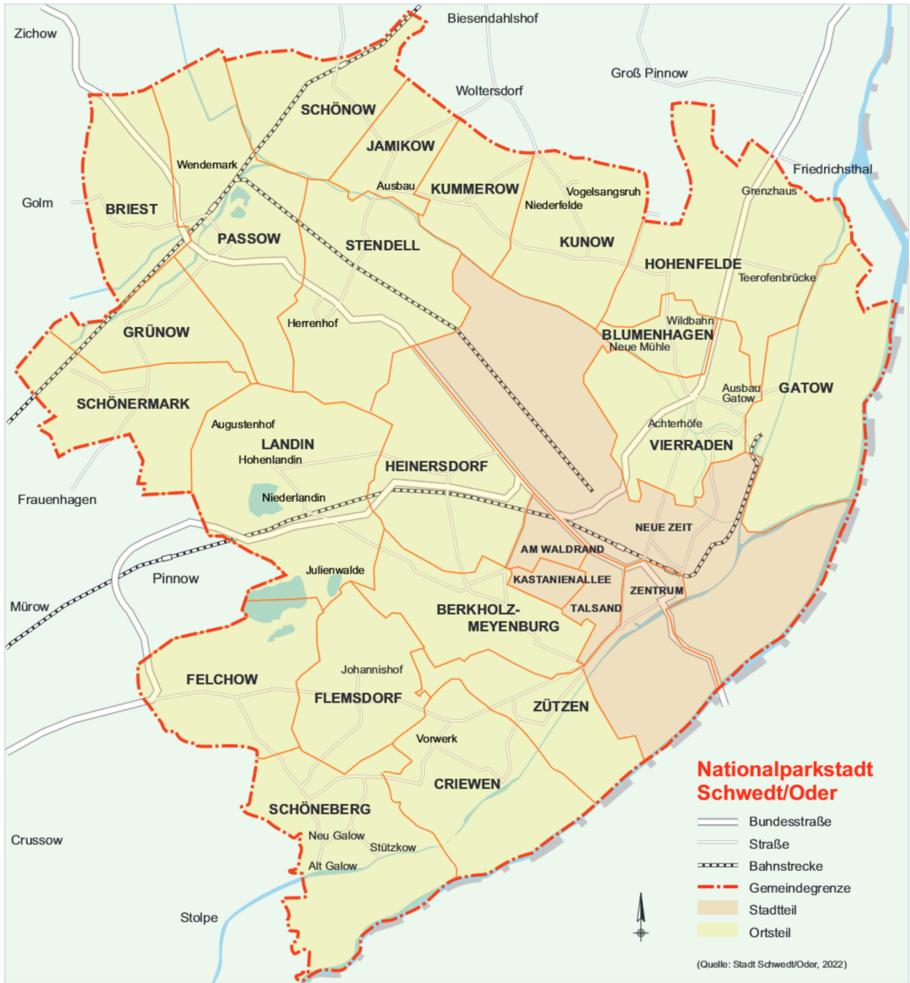
Anlage 1 der Hauptsatzung der Stadt Schwedt/Oder