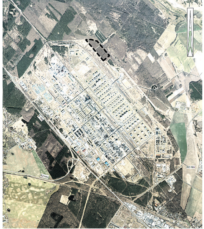
Anlage zur öffentlichen Bekanntmachung über die öffentliche Auslegung des geänderten Entwurfes des Bebauungsplanes „Erweiterung der Industriegebietsfläche der PCK Raffinerie GmbH“ – Darstellung des Geltungsbereiches – April 2015