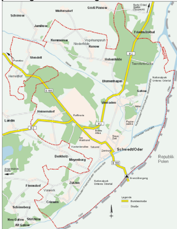
Abb.4: Die Stadt Schwedt/Oder und ihre Ortsteile

Die ortsteilbezogene Jugendarbeit in den 10 Ortsteilen der Stadt Schwedt/Oder mit seinem zentralen, insbesondere strukturellen Ausgangspunkt in Vierraden ist ein zentraler Bestandteil der wohnortnahen und niedrigschwelligen Angebotsversorgung. Durch den mobilen Ansatz werden so insbesondere ehrenamtlich gestützte Jugendräume als Treffpunkte und Anlaufstellen in den jeweiligen Ortsteilen gefördert.