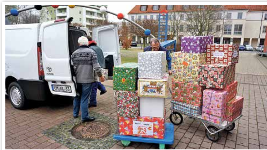
Die Päckchen für die Kinder in Ocland werden verpackt.

Kontakt: Marion Heine, Empfangsmitarbeiterin im Rathaus ☎ 03332- 446100 Verein Rumänienhilfe e. V. Potsdam IBAN: DE45160500003508052663 BIC: WELADED1PMB Kennwort: Kinderheim Ocland