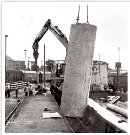
Verladung von Betonelementen

Stadtarchiv Schwedt/Oder Dr.-Theodor-Neubauer-Straße 5 ☎ 03332 446-790 www.schwedt.eu/stadtarchiv