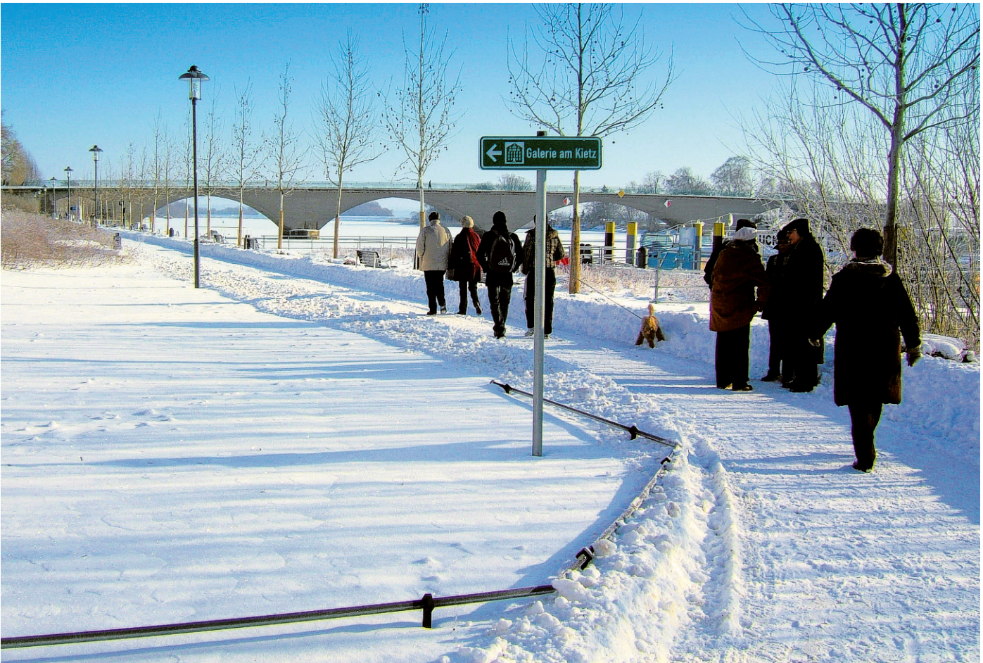
Winterspaziergang am Schwedter Bollwerk mit Blick auf die Stadtbrücke