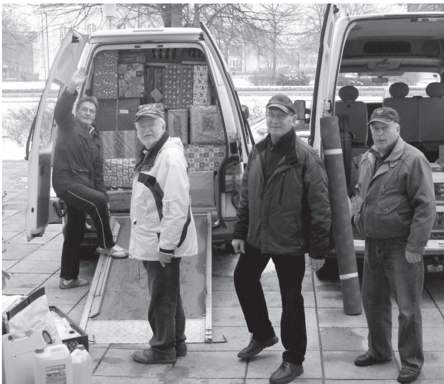
Die Okland-Fahrer bei den Vorbereitungen für die lange Fahrt nach Rumänien.