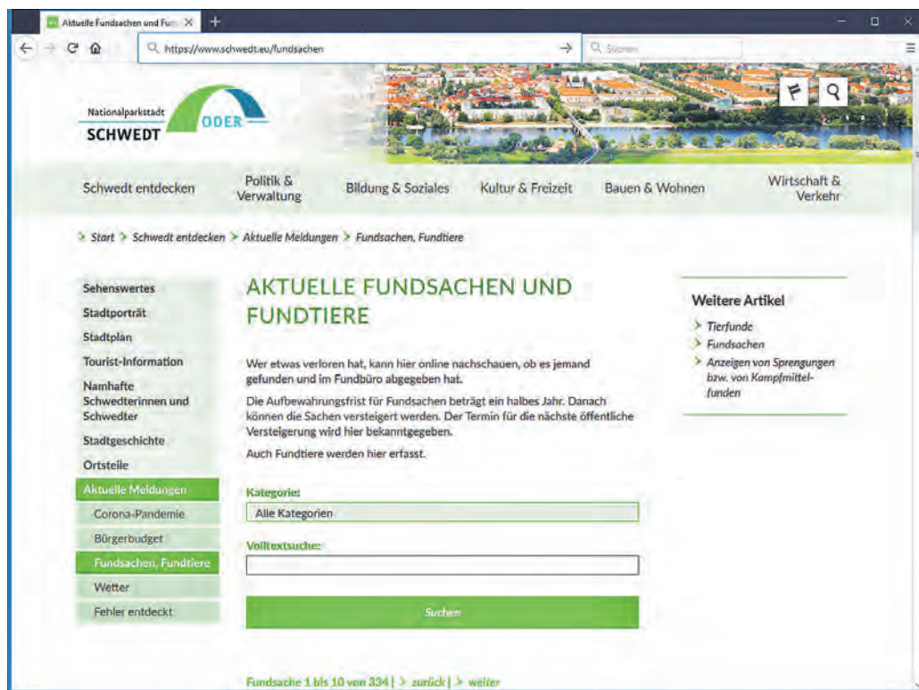
Nach Fundsachen kann man auch online unter www.schwedt.eu/fundsachen suchen.

Das Fundbüro befindet sich im Rathaus, Dr.-Theodor-Neubauer-Straße 5, Telefon 03332 446-635 . Zu den üblichen Sprechzeiten der Stadtverwaltung ist die Mitarbeiterin erreichbar, um bei ihr Fundsachen abzugeben oder nach Verlorenem zu fragen. Die Verwaltung ist verpflichtet, ein halbes Jahr Fundsachen aufzubewahren. Sie werden in einer Datenbank erfasst, die auch online unter www.schwedt.eu/fundsachen einsehbar ist. Dort findet man Schlüssel, Brillen, Taschen, Mützen, Jacken, Handschuhe, ... Auch der Fundort wird benannt. Passen Fundort und Kurzbeschreibung, lohnt ein Anruf. Mittels einer genaueren Beschreibung lässt sich herausfinden, ob das Fundstück dem Gesuchten entspricht.