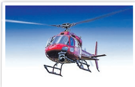
Das besondere Erlebnis zum Fest: Rundflüge mit SkyHeli.

Weiterhin gehören traditionell zum Programm die Partynacht mit den DJs, der Fassbieranstich durch den Bürgermeister, der Lampionumzug, ein buntes Programm auf der Bühne u. a. mit Moden- und Frisurenshows, Bands, Verleihung des Schwedter Agenda-Diploms und der Frühschoppen am Sonntag. Das besondere Erlebnis zum Fest sind Rundflüge über das Festgebiet. Karten sind im Vorverkauf für 45,- € pro Person in der Geschäftsstelle bereits erhältlich. Das Schwedter Oktoberfest beginnt am Freitag um 16 Uhr, Samstag und Sonntag jeweils um 11 Uhr.