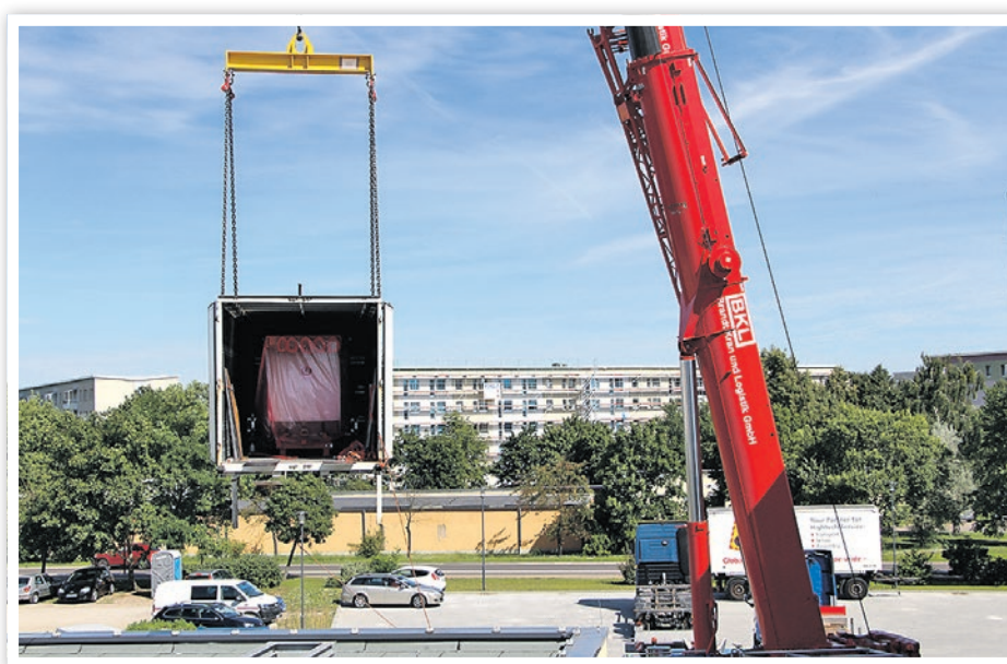
Lieferung des neuen MRT im Asklepios Klinikum Uckermark.

Ein weiterer Unterschied zwischen den nun vorhandenen Geräten ist u. a. ein komfortableres Platzangebot für den Patienten während der Untersuchung.