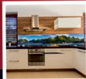
Glasrückwände für Küchen