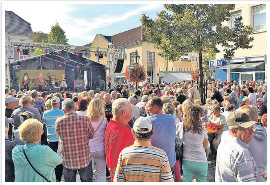
Festgeschehen an der Bühne Auguststraße/Bahnhofstraße.

Das ausführliche Programm ist in der Tourist-Information (Vierradener Straße 31) ab dem 15. September erhältlich.