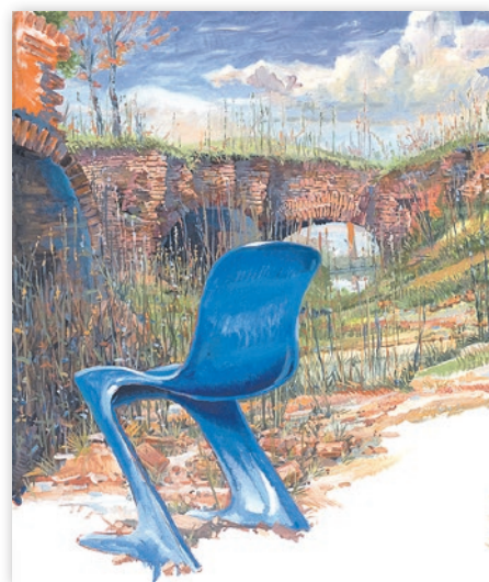
Kackender Affe, Sigurd Wendland, 2007, Öl/Leinwand, 120 x 100 cm

Galerie am Kietz Gerberstraße 2, 16303 Schwedt/Oder ☎ 03332 512410 www.kunstverein-schwedt.de