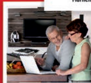
TV- & Multimediawände