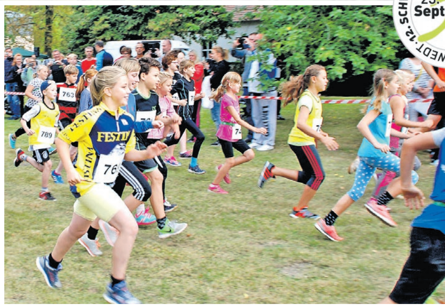
Der Schwedter Nationalparklauf findet am 23. September statt.