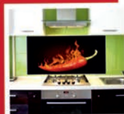
Glasrückwände für Küchen