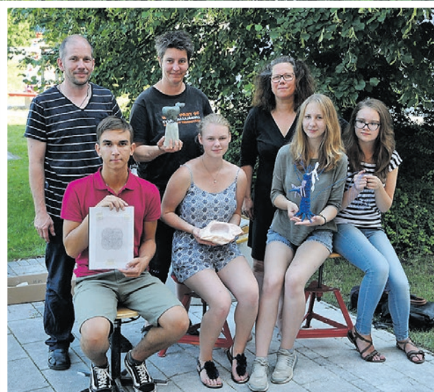
Kursleiter mit Teilnehmern des Kunstcamps

Musik- und Kunstschule Schwedt/Oder Berliner Straße 56 ☎ 03332 266311 ✉ musikschule.stadt@schwedt.de www.musikschule-schwedt.de