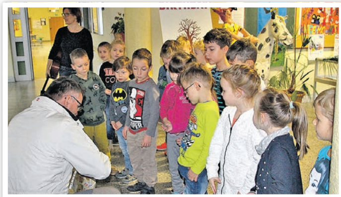
Als Dankeschön für die tolle Gesangseinlage bekamen die Kinder Blumensamen zum Einpflanzen.