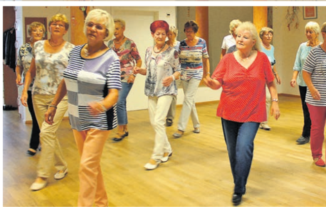
Erlebnistanz mit den Cherry Ladies.

MehrGenerationenHaus, Bahnhofstraße 11b, 16303 Schwedt/Oder ☎ 03332 835040 ✉ mgh-schwedt@volkssolidaritaet.de www.mgh-schwedt.de www.facebook.com/MGHSchwedt