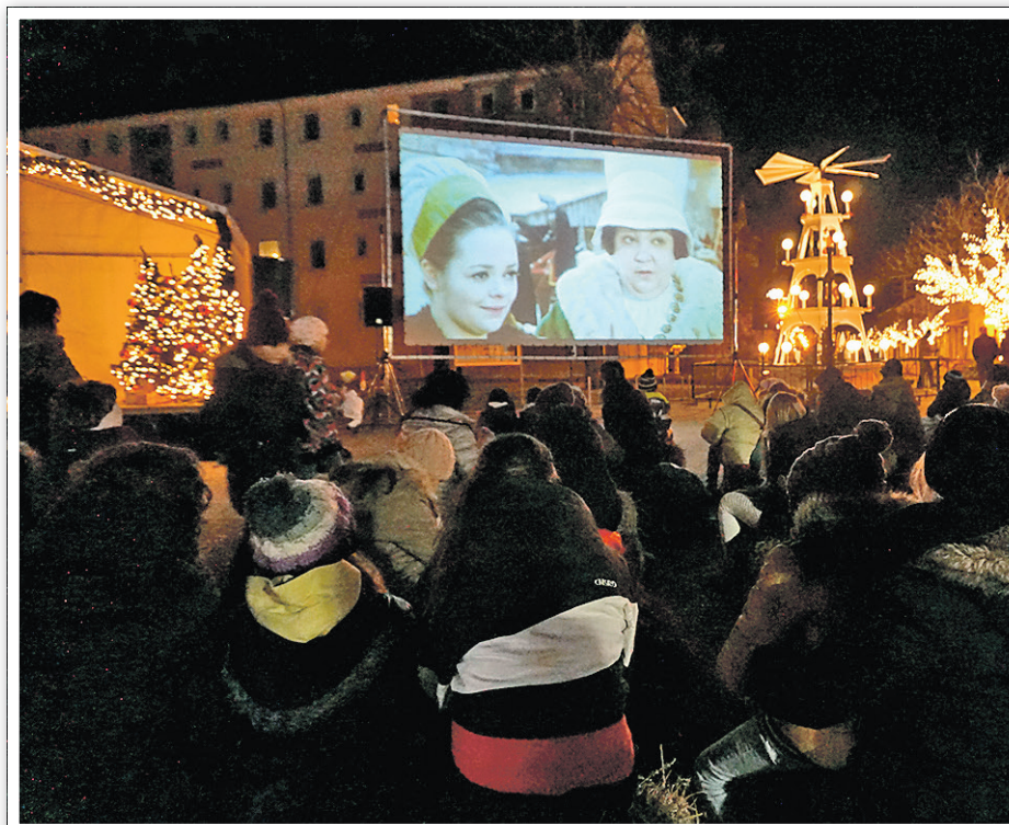
Traditionell das Winter-Kino-OpenAir „Drei Haselnüsse für Aschenbrödel“.

Aktionsgemeinschaft City Schwedt e. V. Vierradener Straße 31 ☎ 03332 517970 www.facebook.com/AGCity.Schwedt