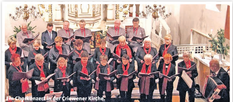
Ein Chorkonzert in der Criewener Kirche.