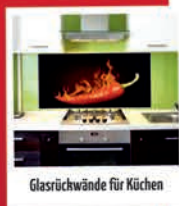
Glasrückwand für Küche