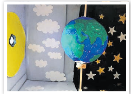
Die Krönung des Projektes war die Anfertigung des Tag-Nacht-Modells.

Die Herbst-Ferienspiele standen in diesem Jahr ganz im Zeichen der Erstellung von Modellen des Sonnensystems und von Naturdioramen. In der ersten Ferienwoche wurde mit viel Fleiß, Leim und Farbe das Sonnensystem für den