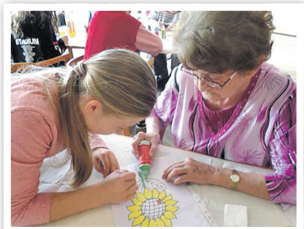
Die Kinder bastelten mit den Senioren zusammen herbstliche Window Color Bilder.

» Die Evangelische Grundschule Schwedt war wieder zu Gast im Seniorenheim „Lea Grundig“ zum Aufbau einer gemeinsamen Kooperation. Dieser Idee sind bereits einige gegenseitige Besuche und die gemeinsame Teilnahme an Gottesdiensten und Festen vorausgegangen. Dabei profitieren von einer Kooperation beide Seiten: die SchülerInnen lernen nicht nur in der Schule, sondern gestalten diakonisches Lernen ganz aktiv mit. Im Umgang mit älteren Leuten, die teilweise auch geistig eingeschränkt und körperlich nicht mehr mobil sind, werden Hemmschwellen gegenüber der älteren Generation abge-