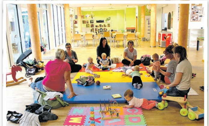
Wer in der Gruppe aktiv werden möchte, ist in der Krabbelgruppe genau richtig.