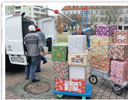
Die Päckchen für die Kinder in Okland werden verpackt.

Die meisten Heimkinder haben bereits langjährige Paten, die regelmäßig für „ihr“ Kind ein Weihnachtspaket packen. Die Pakete können seit dem 6. November im Rathaus, Dr.-Theodor-Neubauer-Straße 5, abgegeben werden. Letzter Abgabetermin ist der 4. Dezember. Anschlie-