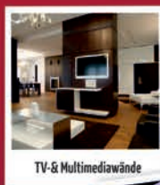
TV- & Mediawand