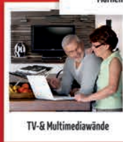
TV- & Mediawand