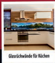
Glasrückwand für Küche