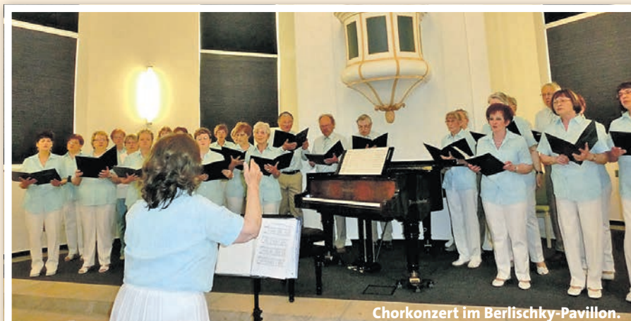
Chorkonzert im Berlischky-Pavillon.