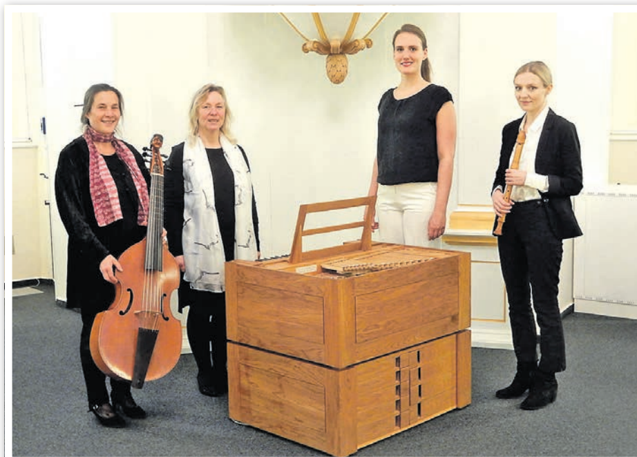
Montagskonzert mit dem Kammerensemble „Uccellini“

Thematisch verknüpfte Programme lebendig zu inszenieren und damit musikgeschichtliche Zusammenhänge in den Konzerten erlebbar zu machen, ist ein wichtiges Anliegen des Ensembles. Dabei geht es um die Erarbeitung von