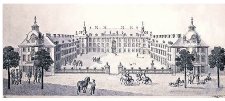
Die Geschichte der Stadt Schwedt/Oder wird mit dem Schlossmodell erlebbar.

» Am 13. April, um 14 Uhr möchten wir mit Ihnen gemeinsam das Schlossmodell enthüllen, die Zeit der Entstehung Revue passieren lassen und die damit verbundene Geschichte