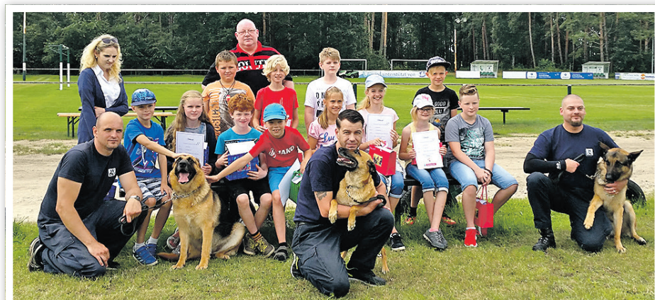
Die Hunde der WDU Dienstleistung GmbH und ihre Hundeführer zeigen, wie man sein Hobby zum Beruf macht.

genau sie mit den Kindern machen möchten. Eine Führung durch das Unternehmen? Eine Bastelaktion im Vereinsheim? Eine Schnupperstunde auf dem Spielfeld? Eine Präsentation des eigenen Handwerks? Den Ideen und der Kreativität der Partner sind keine Grenzen gesetzt.