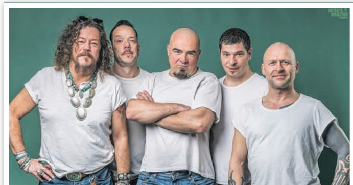
Die Band „Knorkator“ ist beim POTY-Festival auch mit dabei.