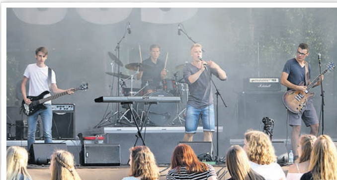
Die Band COS war Gewinner der Wild Card 2017.

» Das Jugendfestival POTY – Passion Of The Young – wird am 29. und 30. Juni bereits zum fünften Mal auf der Waldsportanlage in Schwedt stattfinden. Erstmals erstreckt sich das Festival über zwei Tage, bei dem auch Zelten möglich ist. Das Line-Up steht zum größten Teil fest. Unter anderem werden „Knorkator“, „Swiss und die Andern“, „AberHallo“, „Anne.für.sich“, „einmal einz“ und „Nikaya“ auftreten.