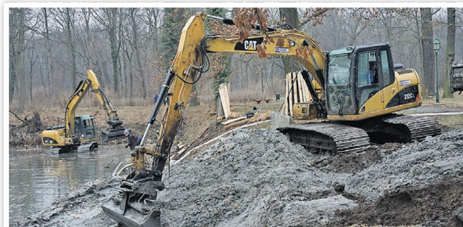
Entnahme von Schlamm und Sand.

Teiche schwankte in den letzten Jahren sehr stark. Außerdem haben sie keinen weiteren Zulauf. Teiche sind ein ideales