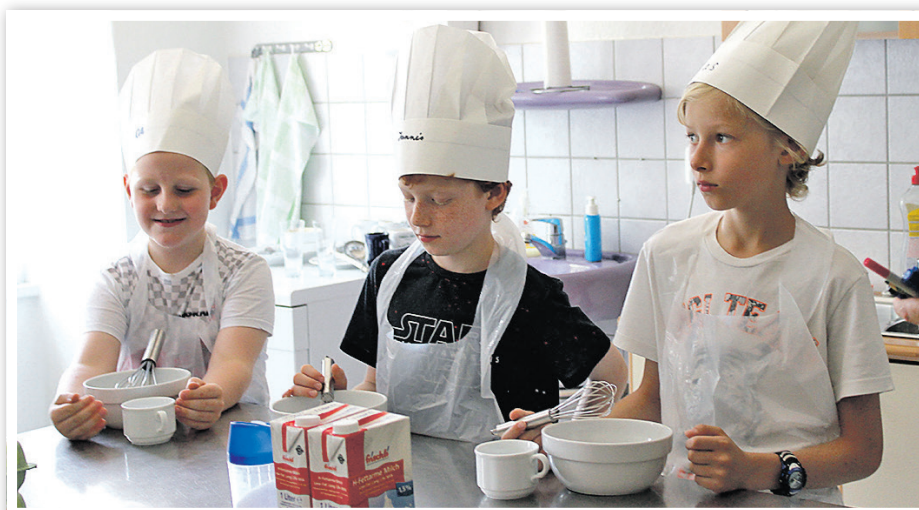
Auch Kochkurse standen im letzten Jahr auf dem Plan.

» Das Schwedter Agenda-Diplom – die Sommerferienspiele für unsere Grundschul Kinder – geht in diesem Jahr in die nunmehr vierte Runde. Das Organisationsteam aus dem MehrGenerationenHaus ist wieder auf der Suche nach Vereinen, Verbänden, Unternehmen, regionalen Produzenten, Handwerksbetrieben, Freizeitangebietern, kirchlichen Gemeinden, Politikern oder freien Honorarkräften, die den Grundschulkindern in den Sommerferien eine oder gern auch mehrere kostenlose Mitmachaktionen bieten wollen. Die Rahmenbedingungen für die Aktionen bestimmen die potentiellen Veranstaltungspartner dabei ganz allein. Sie entscheiden selbst, wann sie eine Veranstaltung mit wie vielen Kindern anbieten möchten. Und vor allem: was