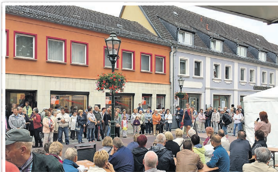
Neu in diesem Jahr: die Modenschau „Mein Frauenzimmer“

Für Kurzweil sorgen verschiedene Kinder- und Familienaktionen. Ein sportlicher Parcours der WOBAG Schwedt, Spiel und Spaß am Stand der Uckermärkischen Bühnen und Stadtwerke Schwedt sowie zwergenhafte Spiele