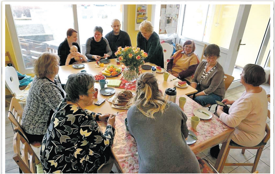
Interessierte Frauen konnten beim „Kochen international“ ihre Rezepte mitbringen, zubereiten und gemeinsam probieren.

Die „Zukunftsinsel“ wurde ihrem Namen als „kleine Insel“ gerecht, um Gedanken auszutauschen und neue Motivation sowie ungewohnte Impulse zu bekommen.