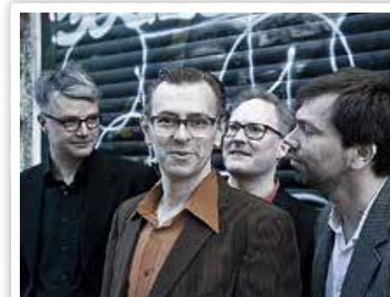
Die Berliner Band „Satumaa“

Jüdisches Museum mit Ritualbad Gartenstraße 6 ☎ 03332 234 60 www.schwedt.eu/de/242989 Einlass ab 14 Uhr, Konzertbeginn 15 Uhr, Eintritt: 10 €