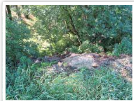
Grünschnitt in Heinersdorf

Wir rufen dazu auf, den kostenlosen, das Stadtbild nicht verschandelnden Weg über den Recyclinghof zu gehen!