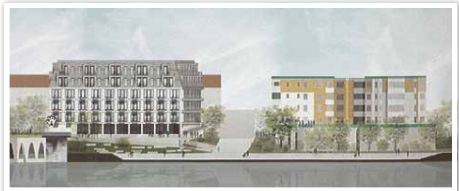
Grafik einer Ansicht von Hotel und Haus Polderblick