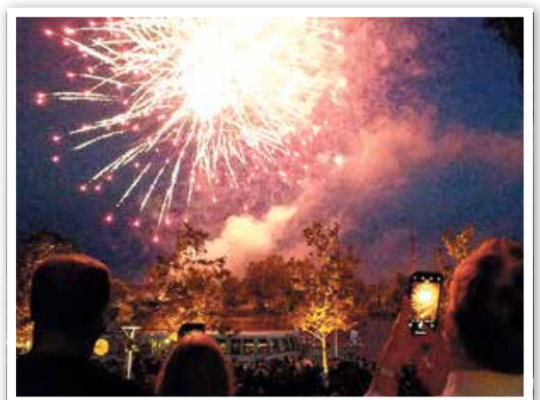
Das 15-minütige Feuerwerk erhielt sogar Applaus.

Mein besonderer Dank gilt den Unternehmen, die das Fest finanziell unterstützten: Wohnbauten GmbH Schwedt/Oder, PCK Raffinerie GmbH, Stadtparkasse Schwedt, Technische Werke Schwedt GmbH, Infra Schwedt Infrastruktur und Service GmbH, WISA Laboratorium GmbH, Bautechnisches Ingenieurbüro Prüfer & Wilke GbR, Baugesellschaft mbH Casekow, Bethke Baumschule-Gärtnerei-Landschaftsgestaltung, Zentral-Apotheke, IPB Indust-