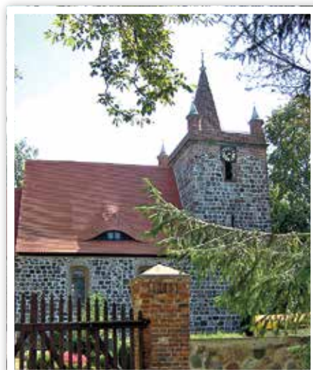
Feldsteinkirche in Heinersdorf

» Am 31. März 2019 wurde durch die Gemeindeglieder der Kirchengemeinde Heinersdorf folgende Festlegung getroffen: