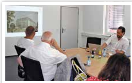
Pressekonferenz im Rathaus

Besonderen Gästen der Raffinerie würde man gern ein Hotel mit Spa in der